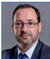
Dominique RAMARD Conseiller régional délégué à la Transition énergétique, Région Bretagne