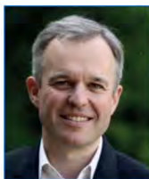
François de RUGY Député de Loire- Atlantique, représentant d'Emmanuel MACRON