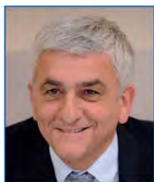
Hervé MORIN, Président, Région Normandie