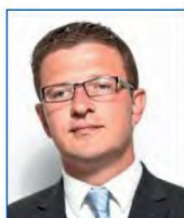
Benoît ARRIVÉ Maire de Cherbourg, représentant de Benoît HAMON