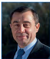
Alain LEBOEUF Député de Vendée, représentant de François FILLON