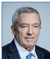
Jean-Louis BAL Président, Syndicat des énergies renouvelables