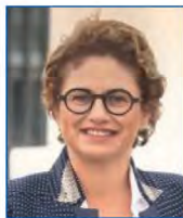
Catherine TROALLIC Députée de Seine-Maritime