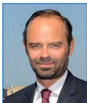
Edouard PHILIPPE Député de Seine-Maritime, Maire du Havre