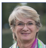
Marie-Noëlle BATTISTEL Députée de l'Isère, Présidente de l'Association Nationale des élus de la Montagne