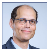
Jean-Charles GALLAND Président de la Commission hydroélectricité, Syndicat des énergies renouvelables