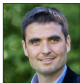
Jean-Charles COLAS-ROY Député de l'Isère, co-Président du groupe d'études sur les énergies vertes