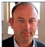
Laurent DUPLOMB Sénateur de Haute-Loire