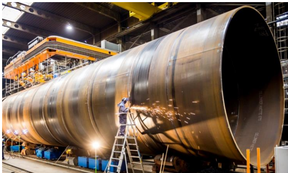
DanTysk, Mer du Nord

La gamme d'aciers de DILLINGER est adaptée à la demande du marché Eolien