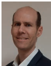
Cédric LE BOUSSE Président de la commission éolien en mer, Syndicat des énergies renouvelables (SER)