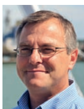
Olivier LE NÉZET Président, Comité national des pêches maritimes et des élevages marins (CNPMM)