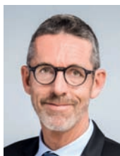
Jules NYSSSEN Président, Syndicat des énergies renouvelables (SER)