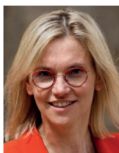
Agnès PANNIER-RUNACHER Ministre de la Transition énergétique