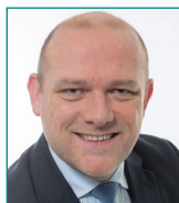
Frédéric NIHOUS Conseiller régional délégué à la politique de l'énergie et à la transition énergétique, Région Hauts-de-France