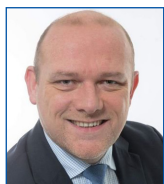
Frédéric NIHOUS Conseiller régional délégué à la politique de l'énergie et à la transition énergétique, Région Hauts-de-France