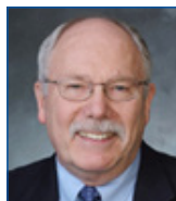
Arnold L. ROBLAN Sénateur de l'Oregon (USA)