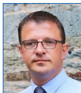
Benoît ARRIVÉ Maire de Cherbourg en Cotentin